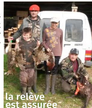
retour de battue

L'entente que nous avons avec l'ACCA Pannessières a été reconduite cette année encore. A l'heure où les regroupements de commune font couler beaucoup d'encre, les chasseurs des deux villages se retrouvent tous les week ends pour organiser des parties de chasse communes.